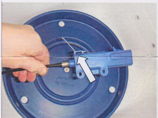
Montera den nya detaljen. Mont the new part.