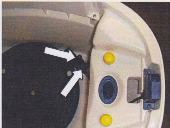
Skruva loss de 2 skruvarna och lyft upp mekanismen. Loose the 2 screw and lift up mechanism.