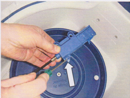
Använd skruvmejsel för att lossa den skadade detaljen Use a screw driver to loose the defected part